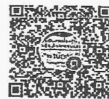
QR Code ไลน์กลุ่ม “ติดตามเด็กออกกลางคัน สนน.”