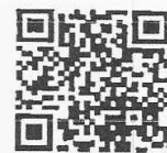
QR Code สิ่งที่ส่งมาด้วย ๑ - ๔