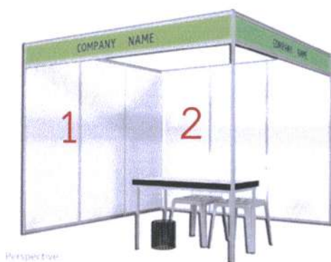
ภาพบูธที่อยู่มุมแถว

ภาพ (ร่าง) โครงสร้างนิทรรศการที่สำนักงานคณะกรรมการการศึกษาขั้นพื้นฐานได้จัดเตรียมไว้